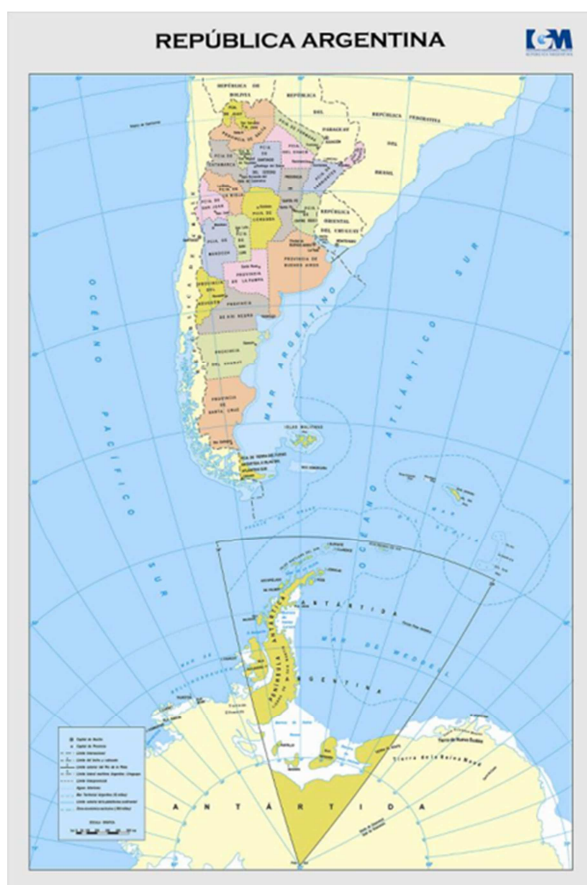
Figura 1. República Argentina

ganadera y conformando nuevos territorios para los desarrolladores, donde el turismo encuentra su potencialidad. En algunos casos detrás de la figura de un promotor, una sociedad anónima y/o un grupo de amigos adquieren la franja litoral o el fondo de las estancias, escasamente productivo para la actividad agrícola-ganadera e intensamente atractivo para el desarrollo inmobiliario basado en modelos de urbanizaciones turísticas de litoral, creando nuevos escenarios para el turismo de sol y playa.