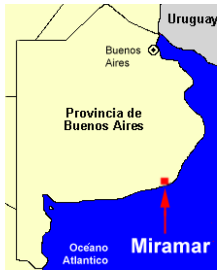
Figura 1. Ubicación de Miramar en la Provincia de Buenos Aires (Argentina)