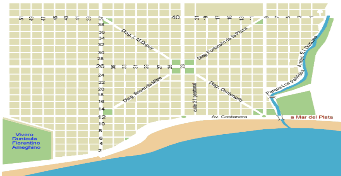
Figura 2. Plano de la ciudad de Miramar