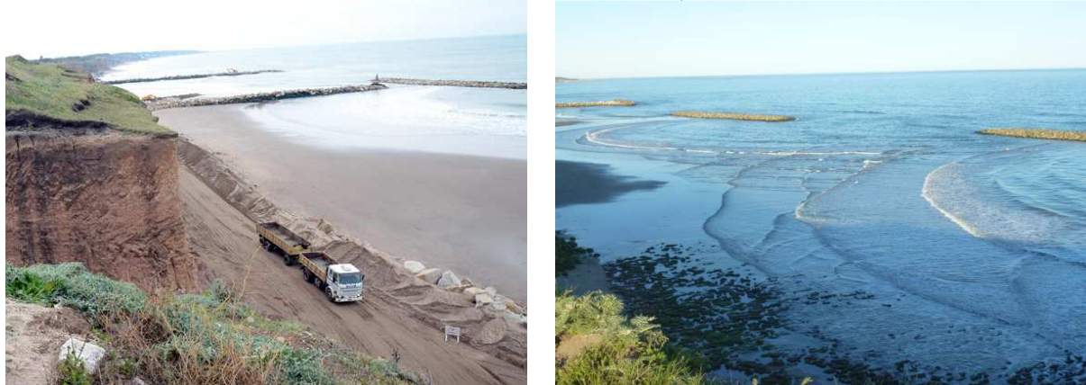
Imágenes N° 2 y 3. Obra defensa costera Playa Los Acantilados

El proyecto consiste en la construcción de un sistema de rompeolas desvinculados de la costa, 110 m. cada uno de longitud, separados entre sí por 130 m., dispuestos en forma paralela a la costa y sin contacto con ella, localizados a 225 m. de la línea de costa, con la intención de disminuir la fuerza del oleaje, descargando allí su energía, para alcanzar la playa con menor intensidad, reduciendo los efectos erosivos (Imágenes N° 2 y 3). El objetivo principal persigue la ampliación de la superficie de arena, mediante la formación de salientes de playa y estabilización de las mismas, de manera de no obstruir el transporte litoral de sedimentos que en ese sector de costa presenta dirección Sur-Norte. Para ello, se prevé la construcción de un sistema de ocho rompeolas rectos aislados (siete en total y uno como prueba piloto de arrecife sumergido multipropósito), dispuestos en forma paralela a la línea de costa.