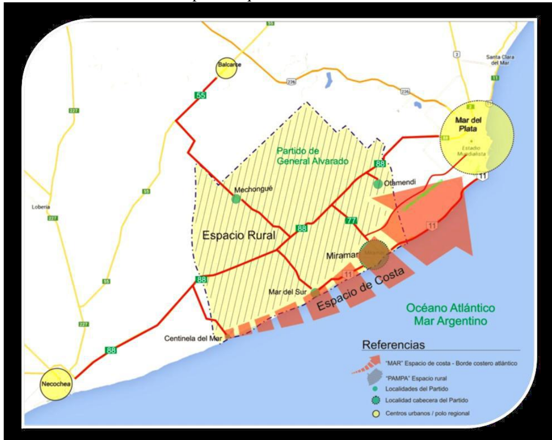
Mapa 1: Esquema territorial

local que conecte regularmente a las poblaciones tanto dentro de cada planta urbana como las conexiones que las vinculan entre sí, lo que dificulta la comunicación entre sus localidades, restringiendo la movilidad interna, suplantado por servicios de coches de alquiler (taxis y remises). Cabe destacar que dentro de la ciudad el uso de motos y bicicletas como medio de transporte está muy generalizado aunque no posee las condiciones adecuadas (como una red de bicisendas o estacionamientos) para su efectivo desarrollo. Además, cabe la ciudad no posee semáforos, lo que dificulta los desplazamientos tanto vehiculares como peatonales.