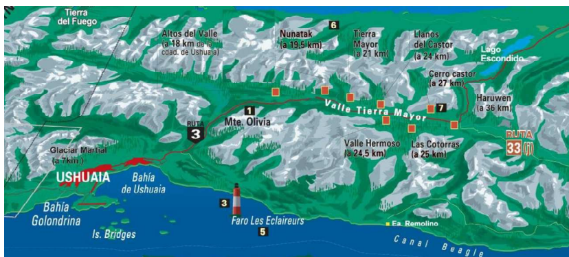
Figura 1. Mapa Centros Invernales

En Tierra del Fuego, la ciudad de Ushuaia se ubica al sur de la Isla, a orillas del Canal Beagle. Con montañas y valles que la circundan, concentra la atención de turistas internacionales, nacionales y residentes mayormente durante la temporada estival (octubre a marzo), aunque también durante la temporada de invierno, motivados por diversos atractivos naturales y culturales donde se realizan las prácticas turísticas. Tierra del Fuego y, en particular, la ciudad de Ushuaia han tenido una estacionalidad muy marcada. Sin embargo, desde hace unos años se ha incrementado el número de turistas durante la temporada invernal (julio a septiembre), principalmente motivados para la realización de prácticas de deportes de invierno, en especial en el Valle de Tierra Mayor. Este Valle constituye una Reserva Natural Paisajística que fue concebida como un corredor turístico determinado a lo largo de la Ruta Nacional 3, a unos 20 km de la ciudad de Ushuaia. Allí, se encuentran varios centros invernales: Altos del Valle, Villa Las Cotorras, Tierra Mayor, Nunatak, Valle Hermoso, Llanos del Castor, Haruwen y el Cerro Castor, que es el centro de esquí más grande de la provincia.