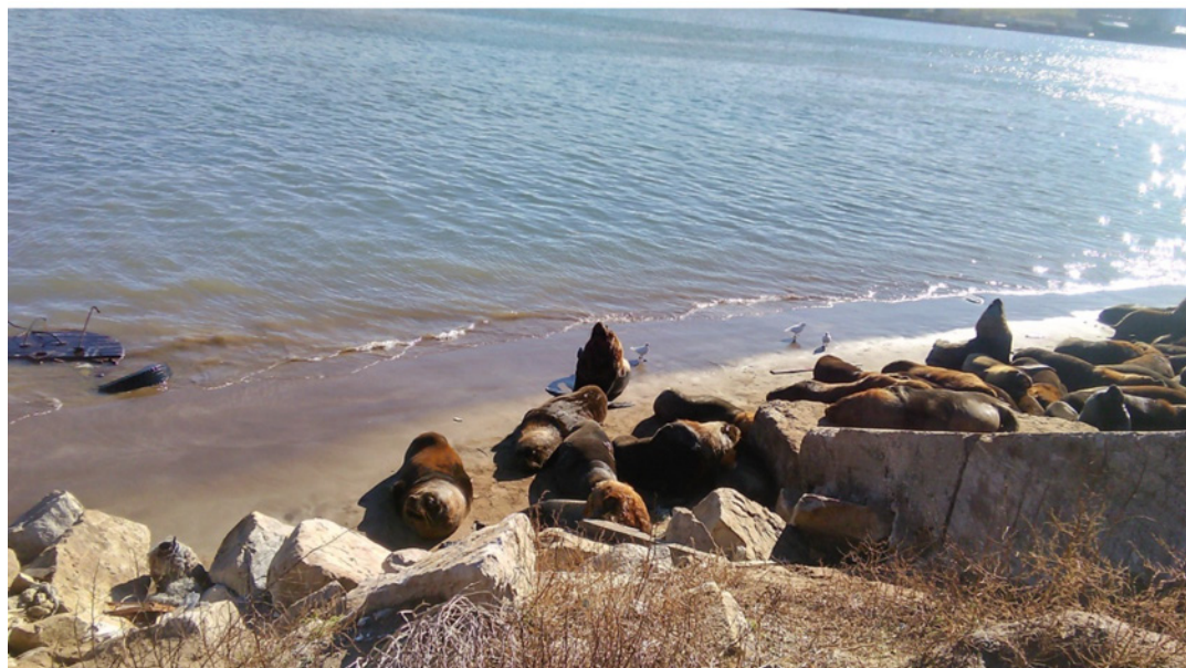
Figura 3. Lobería Escollera Sur. Fuente: archivo personal (2019).