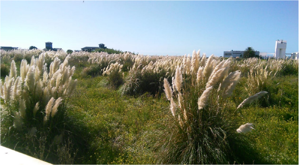
Figura 2. Reserva Natural Puerto Mar del Plata.

La colonia posee un carácter no reproductivo, al estar integrada casi exclusivamente por ejemplares machos. Esto se debe a que la especie posee un sistema de reproducción de tipo harén (Jefferson, Leatherwood, y Webber, 1993). Esta situación genera un excedente de machos, tanto los senescentes, los lesionados, los juveniles, entre otros, que tienden a agruparse para su protección en colonias no reproductivas.