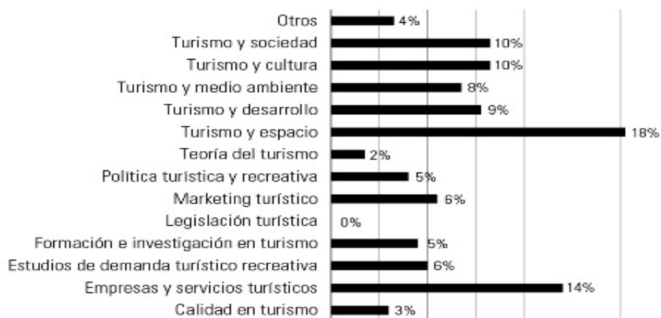
Figura 3. Clasificación de artículos por temática

Con respecto a la clasificación de artículos por temática (Figura 3), se observa que prevalecen aquellas vinculadas al turismo y espacio (18%), seguidas por empresas y servicios turísticos (14%), turismo y sociedad y turismo y cultura (10%), turismo y desarrollo (9%), turismo y medio ambiente (8%), marketing turístico, los estudios de demanda turístico-recreativa (6%) y política turística y los estudios de formación e investigación en turismo (5%). Los restantes temas no alcanzan este último porcentaje.