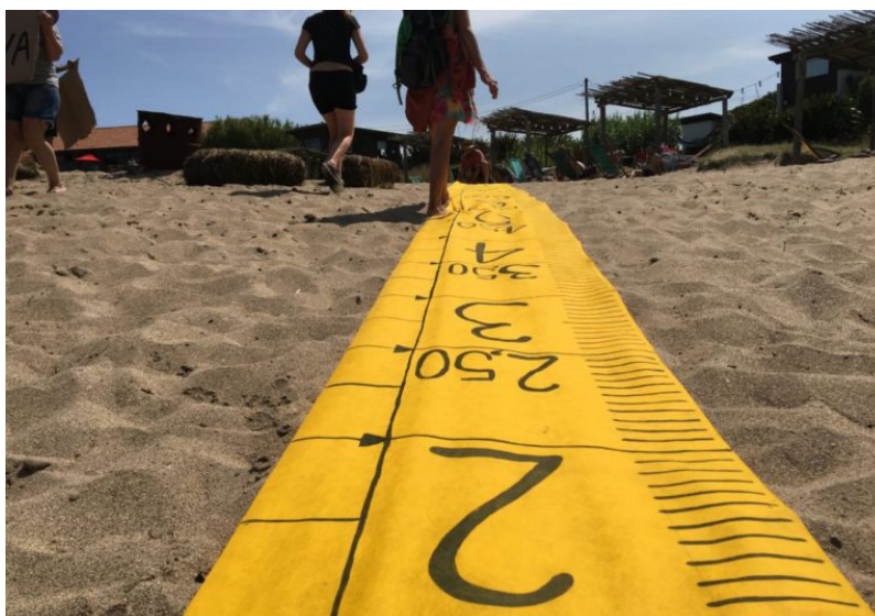
Figuras 1 y 2 ACCIÓN COLECTIVA ASAMBLEA LUNA ROJA. ENERO 2020

Es de señalar que la primera asamblea se dio en plena temporada en el espacio público de playa del balneario Luna Roja, recuperado como consecuencia de medir el perímetro correspondiente según normativa. A esta iniciativa se sumaron residentes y turistas que frecuentaban el balneario (ver Figuras 1 y 2). Cabe destacar que la acción de denuncia por vía judicial se complementó con acciones vinculadas al reacondicionamiento del acceso público al balneario (reforestación con vegetación nativa, señalética referida a observación de aves jornadas de limpieza), dando lugar a una hibridación entre una vertiente legal de denuncia de conflicto y una vertiente asociada a la imaginación y construcción del territorio en función de sus concepciones y experiencias de vida.