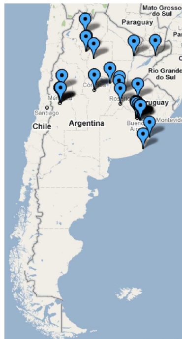
Gráfico 3. Distribución de universidades privadas argentinas.

Puede fácilmente observarse en los gráficos 3 a 5 cómo las universidades privadas se encuentran en las zonas más pobladas del territorio argentino, con fuerte concentración en la Ciudad Autónoma de Buenos Aires, con presencia a Córdoba y Mendoza y, en menor medida, en otras provincias del norte argentino.