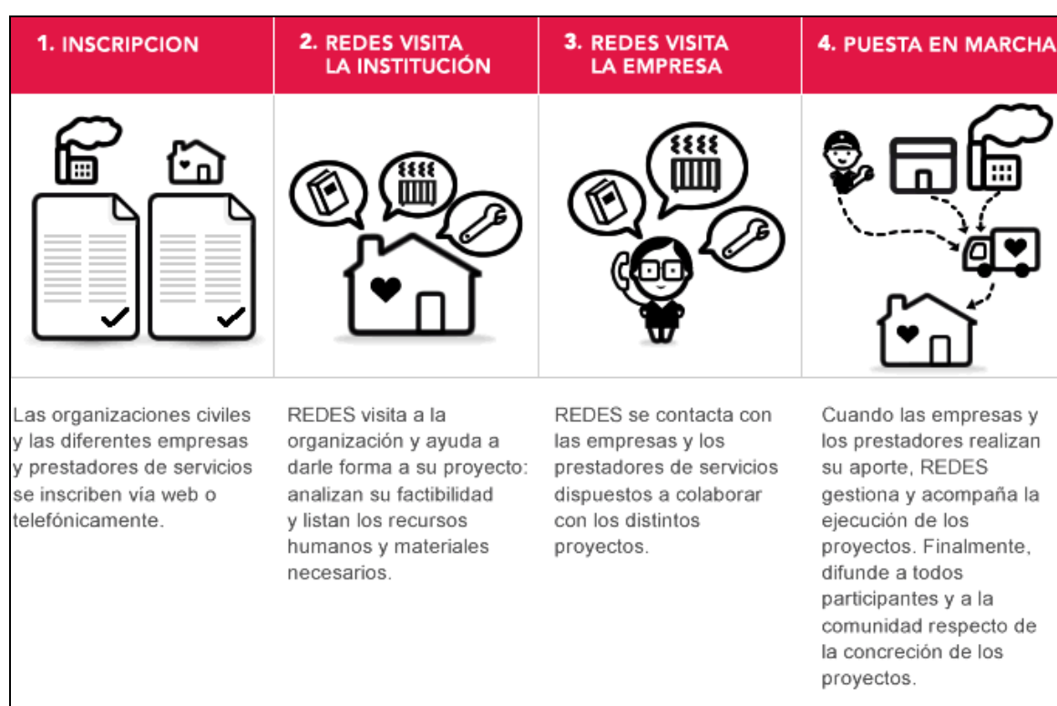
Figura 2. Mecanismo de funcionamiento de REDES

estudiantes que se han inscripto como voluntarios son convocados a una reunión informativa y una posterior capacitación, que incluye temáticas tales como el rol de las organizaciones de la sociedad civil, la responsabilidad social empresaria, técnicas de entrevista, condiciones para que las empresas puedan desgravar parte del impuesto a las ganancias a partir de donaciones realizadas y, especialmente, el mecanismo de funcionamiento del proyecto.