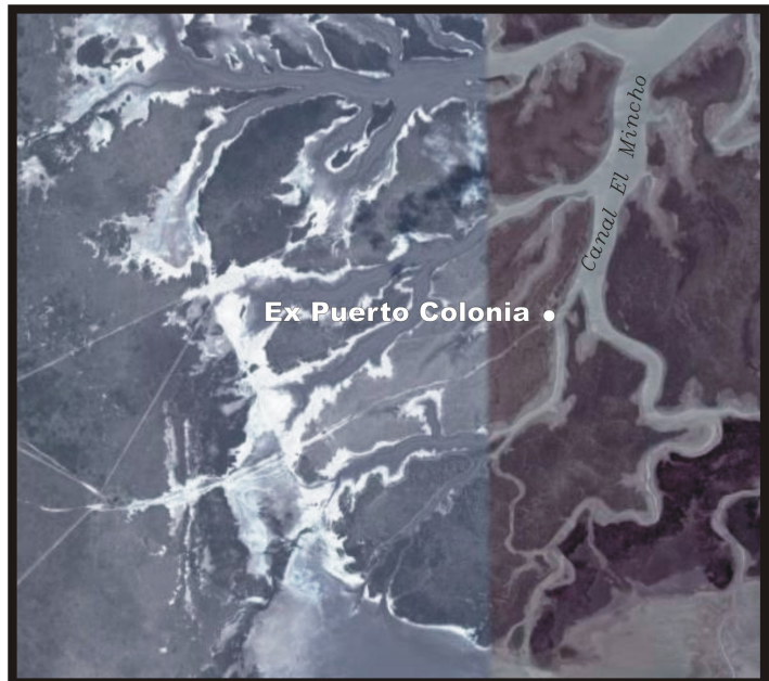
Imagen Google Earth. Escala: 1:1 150 000 Modificación

Modificación Imagen Google Earth. Escala: 1: 44 000