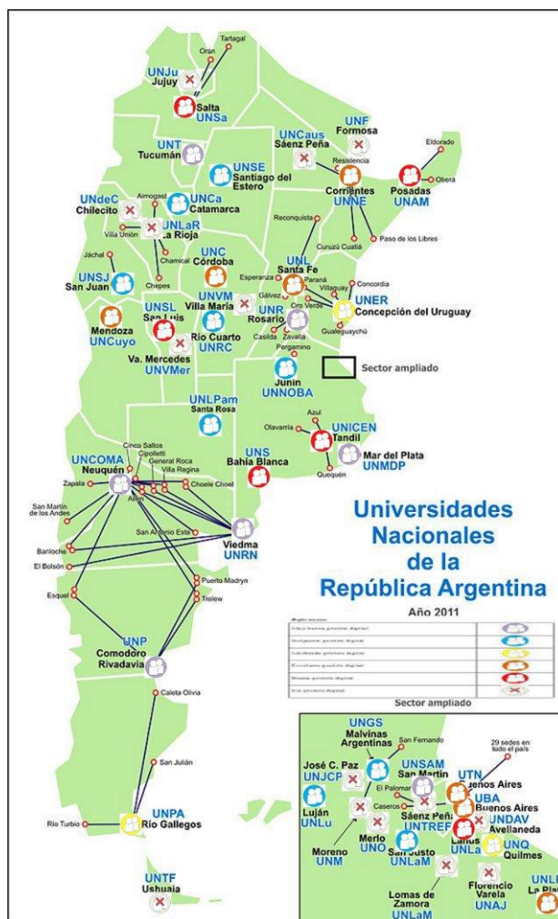
Imagen 1. Elaboración propia. Mapa de la gestión digital de las UUNN