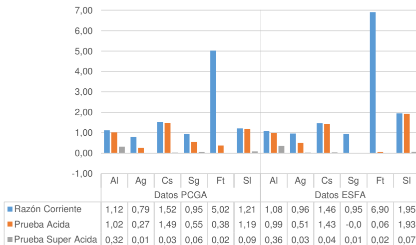
Figura 1. Valores entre PCGA y NIIF de las razones financieras que miden la liquidez en la empresa.