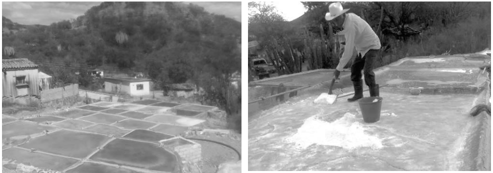
Figura 5. Cajetes en el proceso de sal

En entrevistas realizadas a los empresarios sociales de la salinera de San Pedro Salinas, estos consideran que los principios y valores propios de la génesis de los usos y costumbres son una fortaleza que les ha permitido mantenerse como productores y comercializadores de la sal, dado que gracias a la mutua cooperación y solidaridad han mantenido su producto en el gusto de sus clientes. Además, consideran que su sal posee un sabor original que la hace agradable al paladar, debido al proceso artesanal con el que se produce (véase Figura 4 y Figura 5 ), contrario a los casos de las plantas de sal de Salina Cruz que comercializa una sal muy fina con un sabor fuerte, que proviene del mar y que se extrae con maquinarias.