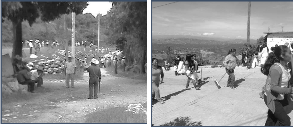
Figura 3. Tequio de hombres y mujeres en beneficio de la comunidad (Fuente: Elaboración propia, 2017)

trabajo gratuito comunitario, voluntario y colectivo. Por ejemplo: en la construcción de una casa, los hombres hacen la labor de albañiles y las mujeres de cocineras; asimismo, para mantener limpia la comunidad y libre de contaminantes, los hombres realizan acciones para segar la hierba del camino y las mujeres de barrer las calles (véase Figura 3 ). Es una organización rigurosa y se constituye en una obligación para los ciudadanos; si no participan, se aplican sanciones (multas económicas, suspensión de beneficios, entre otras acciones que conllevan a la conscientización del beneficio del trabajo colaborativo) que impone la autoridad designada por la propia sociedad y, por ende, otorgan liderazgo, autoridad y respeto.