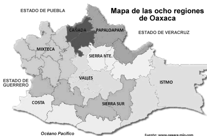
Figura 2. Mapa de las ocho regiones del estado de Oaxaca