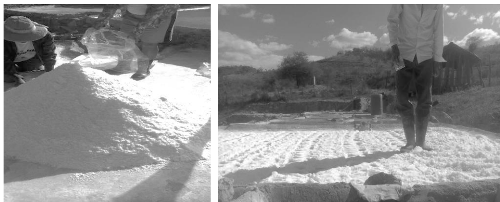
Figura 4. Proceso de la sal blanca y sal de grano

La salinera de San Pedro Salinas, es una organización de carácter de la economía social que ofrece al mercado dos tipos de sal: la sal blanca y la sal de grano o tierna. Este tipo de sal tiene una textura y sabor peculiar, puesto que el método de extracción es el transmitido por generaciones desde la época prehispánica, sus pobladores le llaman “el proceso original” (Figura 4). Acorde con el conteo poblacional realizado en el estudio de campo, la población de San Pedro Salinas hasta enero del 2017, es de 58 habitantes, de los cuales: 13 son mujeres adultas-maduras, 12 hombres adultos-maduros, 5 hombres adultos-jóvenes, 8 mujeres adultas-jóvenes, 9 niños y 11 niñas. Del total de la población, las personas que trabajan en el proceso de la sal, son mujeres y hombres de entre 15 a 60 años de edad.