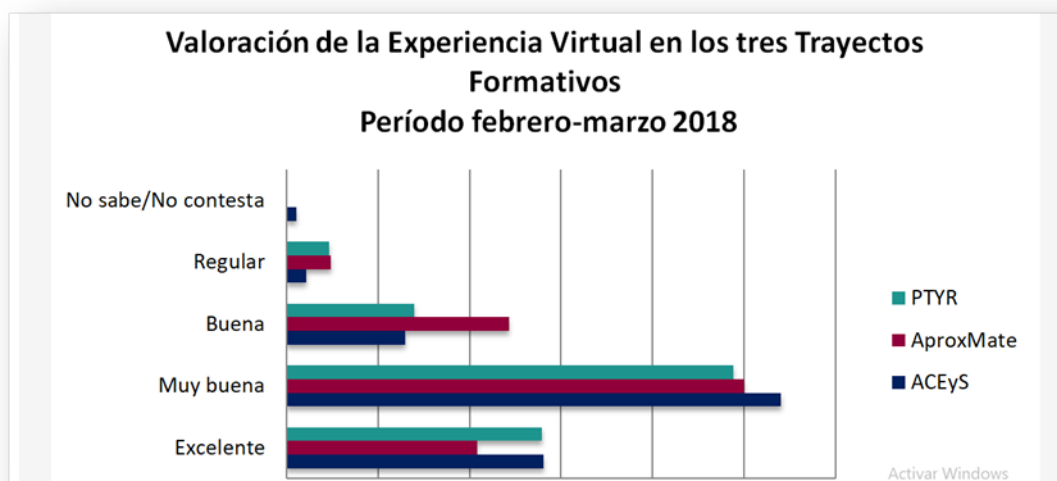
Gráfico 2. Valoración de la Experiencia Virtual

En segundo lugar, la valoración de la experiencia expresada por los estudiantes. A través de los datos que aporta el siguiente gráfico, apreciamos que la valoración de la experiencia obtiene sus porcentajes más altos en “muy buena”. Siguiendo a ésta, las valoraciones “excelente” y “buena” en ese orden. Un porcentaje muy pequeño opta por “regular” para todos los trayectos, o bien “no sabe/no contesta”. Asimismo, cabe destacar que esta distribución mantiene su tendencia en cada edición.