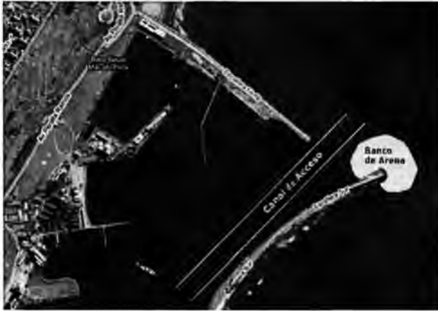
Imagen 1: Banco de arena en el puerto de Mar del Plata.

boca de acceso a la estación marítima (imagen 1). Esta situación se genera por la arena en suspensión que transporta la deriva costera de sur a norte, y que es depositada al interceptarse con la Escollera Sur. Se han realizado obras para remediar esta situación. En 1998, por ejemplo, el gobierno provincial emprendió una obra que permitió remover unos 3 millones de metros cúbicos de arena. En aquella oportunidad la arena que extrajo la draga holandesa Amazon fue derivada a las playas céntricas, que pudieron recuperar de este modo hasta un 300% de la superficie que había sido perdida por la erosión.