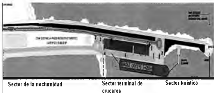
Figura 3: Nuevos sectores de la Escollera Norte.

El sector comercial o de la nocturnidad es el más cercano a la costa, concentra la actividad de locales y es donde se ubican todos los edificios del proyecto. Se pretende generar una diversidad de usos, una mezcla de entretenimiento, gastronomía y compras que incentive el recorrido. Se propone un salón del deporte argentino, museo del cine, y una sala de récords. Este sector incorporaría el traslado de bares nocturnos de la calle Alem de la ciudad.