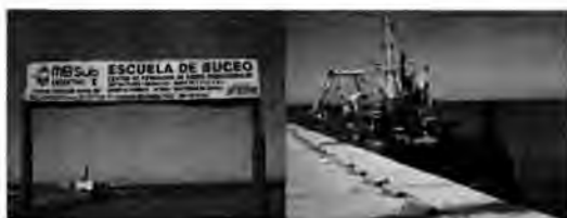
Fotos 1 y 2: Usos de la Escollera Norte. Fuente: archivo personal (23/11/2010)

Como se puede observar en la tabla 1, la mayor parte de los actores actuales de la Escollera Norte, son dependientes en sus usos de la localización en dicho espacio. Por tal motivo, la posibilidad de incorporar más usos, requiere la permanencia de estos usos y su compatibilidad con los usos futuros.