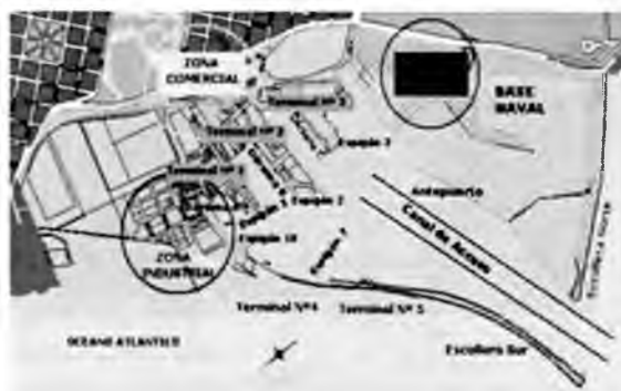
Figura 2: Zonificación del Puerto de Mar del Plata. Sonriza

Naval, es manejada por la Armada, mientras que del rompeolas hacia el otro extremo, manejada por el Consorcio Regional Portuario Mar del Plata. Por dicho motivo, se reconoce que la Escollera Norte no es considerada dentro del C.O.T (Código de Ordenamiento Territorial) de la localidad de Mar del Plata.