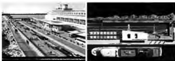
Imagen 5 y 6: Nuevos usos de la Escollera Norte.

La idea del tercer y último sector ubicado en el extremo de la escollera, es una plaza de entretenimientos, un espacio para la realización de eventos y espectáculos al aire libre en estrecha relación con los bares. Se proyecta el desarrollo de un Parque de los Vientos público en el extremo de la escollera, este tendrá un área de esculturas de viento producidas por artistas nacionales; estacionamiento; y lugares para sentarse a mirar el puerto. Los molinos de viento podrían colaborar en generar una parte de la energía que se consuma en la escollera, sirviendo a la vez como un elemento que identifica el sitio a la distancia y como ejemplo de desarrollo sustentable para la ciudad y la provincia.