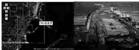
Imagen 3 y 4: Localización del INIDEP.

Los actores que encontramos en el área de estudio son de gran diversidad, sin embargo, teniendo en cuenta la clasificación de Sorensen (1994), no todos estos usos dependen necesariamente de su localización en el espacio costero (costero dependiente), sino que muchos podrían tener una localización independiente del mismo, pues no requieren exclusivamente de la presencia de la costa (costero no dependiente), tales como locales comerciales y unidades habitacionales en alquiler. (Tabla 1)