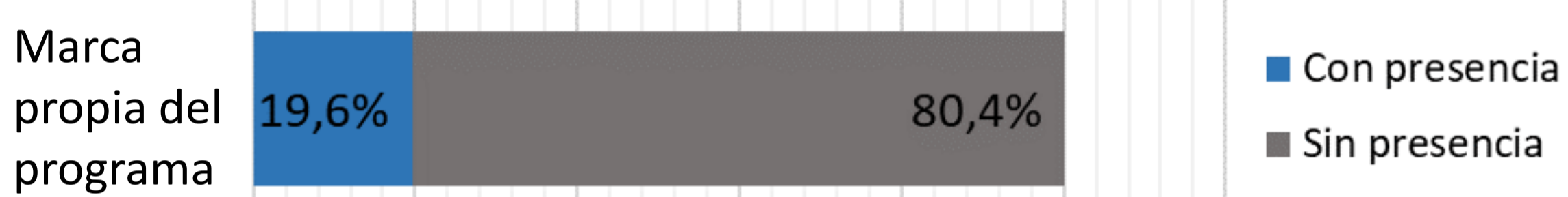
Gráfico 1. Identidad de marca del PVC en las empresas con presencia digital del Índice Merco-2018.

Utilización de espacio propio de voluntariado que visibiliza las actividades de los programas