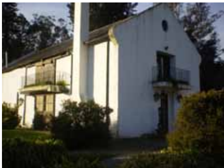
Foto 6: ex-depósito de maquinaria e insumos agrícolas, actual restaurante La Trinidad