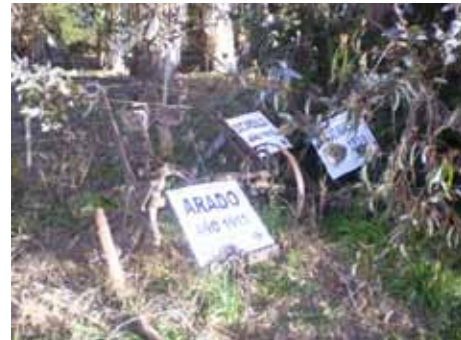
Foto 5: exposición de antigua maquinaria agrícola (arado 1915, escardillo 1910)