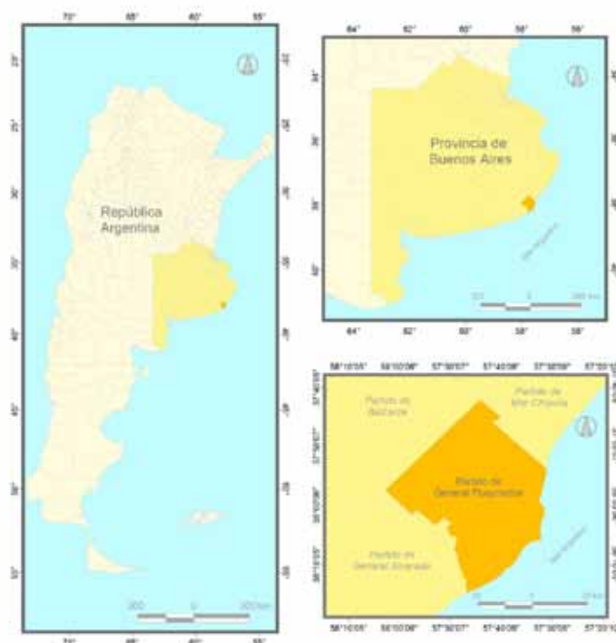
Mapa 1: Localización del partido de General Pueyrredón