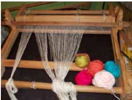
Foto 3: elaboración de prendas artesanales con lana de llama y oveja