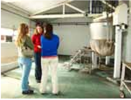
Foto 1: recorrido guiado por tambo y antigua fábrica de quesos y dulces