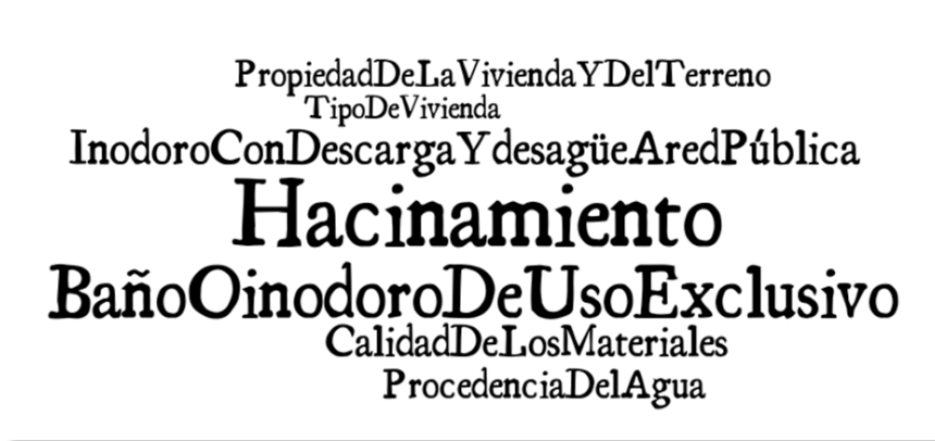
Figura 4. Palabras clave asociadas a la dimensión vivienda