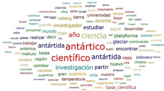
Figura 3: Frecuencia de términos sobre ‘ciencia’.

presencia en la agenda mediática sobre estos temas que trascienden a nivel global. Estos resultados se pueden relacionar con lo obtenido en la nube de palabras (Figura 3) donde se destaca cómo diferentes términos vinculados con el ámbito educativo, con la investigación y con la ciencia en la Antártida aparecen de forma recurrente.