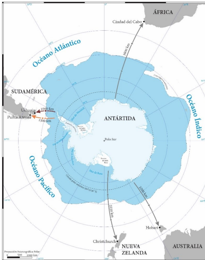
Figura 1. Ubicación de Ushuaia y Punta Arenas como puertas de entrada a la Antártida.