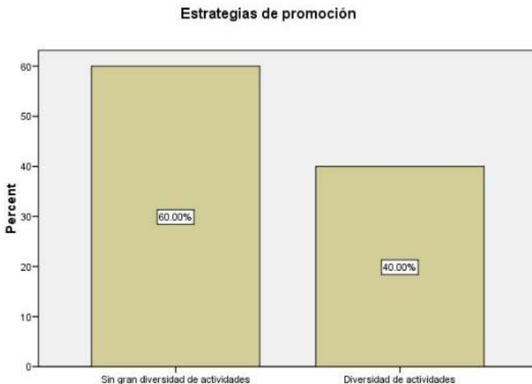
Figura 4. Dimensión operacional: Estrategias de promoción

Las observaciones en la Figura 4, muestran un mayor nivel de actividades de promoción y difusión sin diversificar, esto significa que preferentemente se trata de actividades de índole espontánea y participativa, mientras que el 40% presenta actividades programadas tanto comunicativas como participativas como por ejemplo ciclos de debates y talleres, con la elección de diferentes estrategias y preferentemente la utilización de la mayoría de ellas.