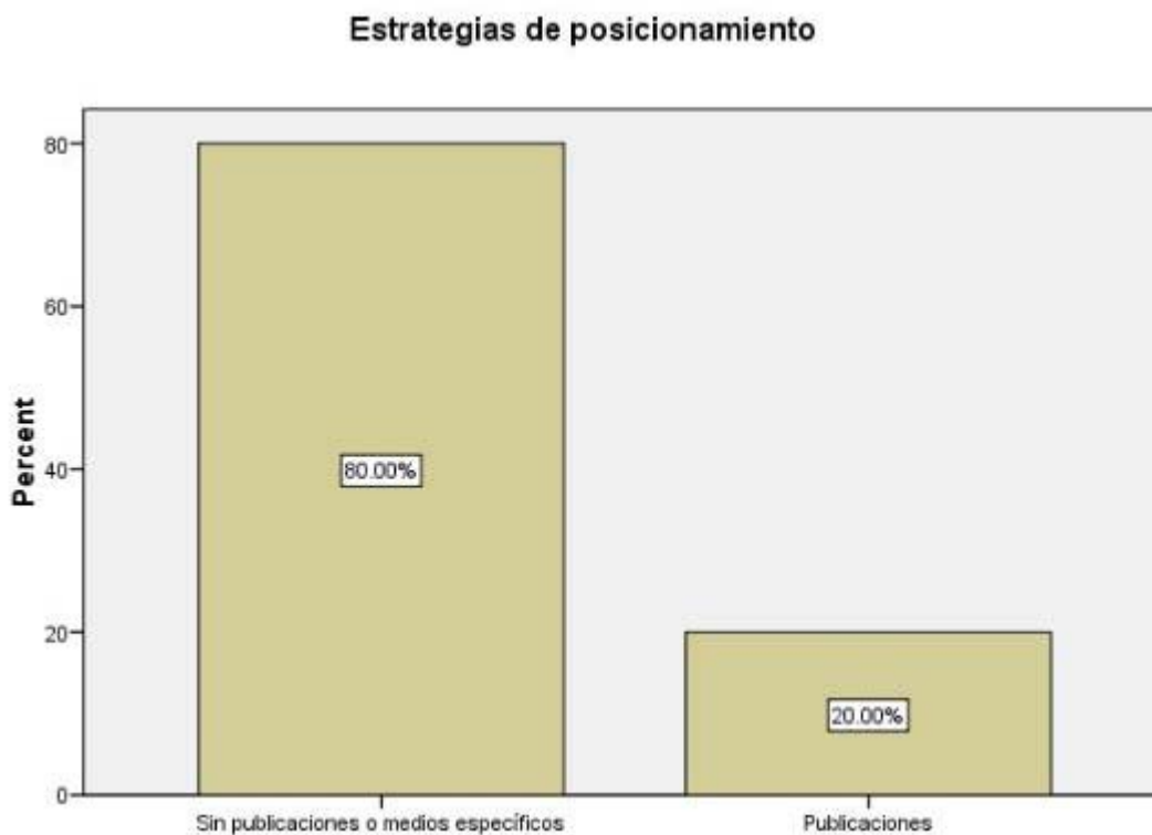
Figura 6. Dimensión operacional: Estrategias de posicionamiento

En la dimensión operacional, la evaluación comparativa de los sitios web de vinculación presenta en las estrategias de posicionamiento en la Figura 6, en la cual más de la mitad de las UUNN bonaerenses presentan estrategias participativas y que no se encuentran ajustadas a un cronograma específico, mientras que un 40% presenta la conjunción de estrategias posibles ya sea ajustadas a un cronograma como ciclos de debate o que surjan frente a una situación específica.