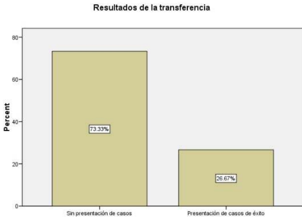
Figura 3. Dimensión estructural: Resultados de la transferencia de las UUNN bonaerenses

En la dimensión estructural, la evaluación comparativa de los sitios web de vinculación presenta en la Figura 3, los resultados de la actividad de transferencia en términos de éxito, en la cual las tres cuartas partes aproximadamente de las UUNN bonaerenses no presentan casos de éxito, refiriéndose a resultados de proyectos específicos publicados en la sede web, que exponen una mejora en los procesos productivos de las organizaciones contratantes o bien, una contribución a la mejora de la calidad de vida de la comunidad, del desarrollo sostenible y de las condiciones ambientales entre otras posibles.