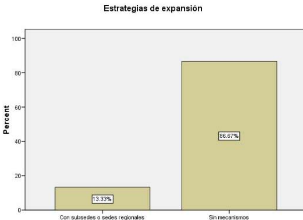
Figura 5. Dimensión operacional: Estrategias de expansión

En la dimensión operacional, la evaluación comparativa de los sitios web de vinculación presenta las estrategias de posicionamiento de la actividad en la Figura 6, en la cual se observa que la mayoría de las UUNN bonaerenses no presentan a los destinatarios de los productos y servicios que ofrecen, información específica dirigida al sector público o privado a través de diferentes instrumentos impresos o digitales como newsletters , boletines, gacetillas o informes – seriadados o no – .