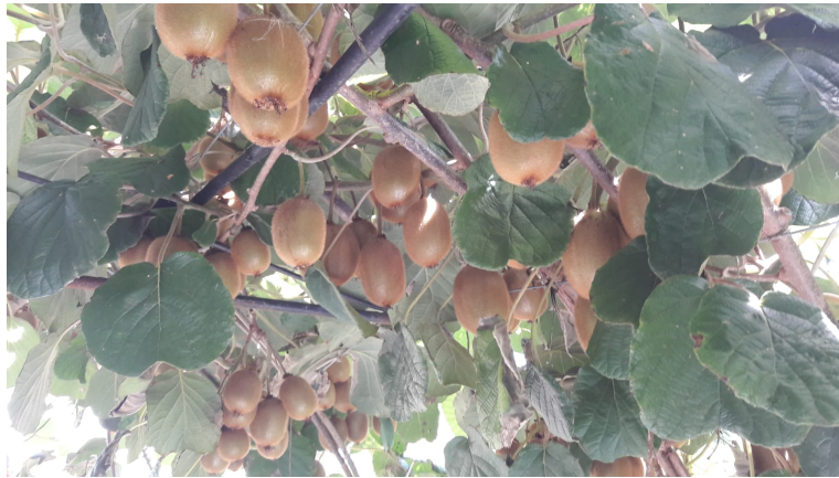
Foto 3: Frutos de kiwi. Sierra de los Padres. Marzo 2021.

La metodología aplicada en el módulo I, se basó en una encuesta con degustación de productos a consumidores y en entrevistas a los responsables de la comercialización mayorista. En octubre 2020, se llevó a cabo una degustación domiciliaria (61 consumidores de kiwi, no expertos, no entrenados), para contrastar el sabor, color de la pulpa, aroma, consistencia/firmeza y apariencia externa de kiwis regionales y chilenos, en una cata a ciegas. Los consumidores participantes destacaban el mayor equilibrio de dulzura y acidez del sabor y la firmeza de la pulpa como atributos que fundamentaban sus preferencias hacia la fruta de la región. (Fotos 4 y 5).