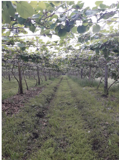
Foto 2: Plantación de kiwi. General Alvarado. Noviembre 2021.