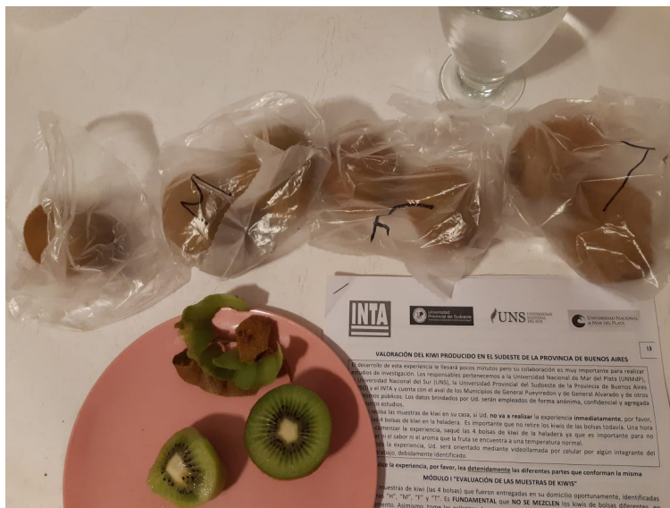
Foto 5: Registro de la degustación en un domicilio de Mar del Plata. Octubre 2020.

Se realizaron entrevistas en uno de los mercados mayoristas de la región (PROCOSUD), a los responsables de los puestos de venta de frutas, indagando sobre los atributos del producto más valorados y sus opiniones sobre la calidad del kiwi local. Todos reconocen que el sabor del kiwi de esta región es superior y lo asocian al nivel de maduración del producto al momento de su cosecha. Los productos importados no llegan en las mismas condiciones, aunque muchos de los clientes (vendedores minoristas) se interesan relativamente más en el precio que en la calidad del producto.