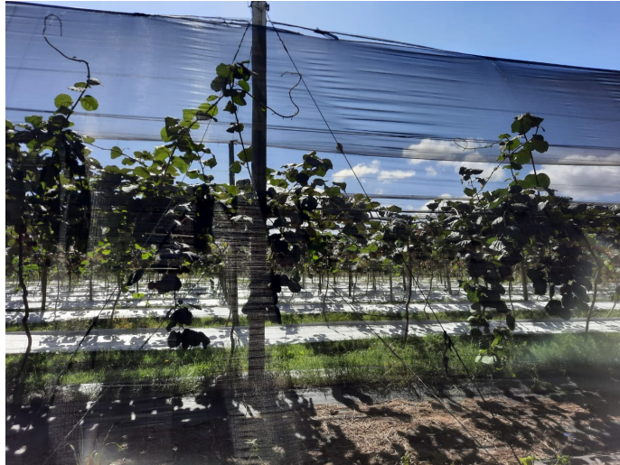
Foto 1: Plantación de kiwi. Sierra de los Padres. Marzo 2021.

y los responsables de la comercialización mayorista, para distinguir efectivamente los atributos en base a los cuales trabajar para lograr la diferenciación del producto; II) La calidad objetiva, desde una perspectiva agronómica, con parámetros que permitieron comparar el kiwi local con otros importados y nacionales disponibles en la zona; y III) La cuantificación del valor agregado por la producción de kiwi y su aporte al potencial crecimiento de la región.