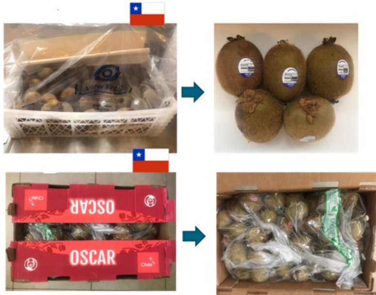
Foto 6: Kiwi chileno adquirido en mercado mayorista. Septiembre 2020.