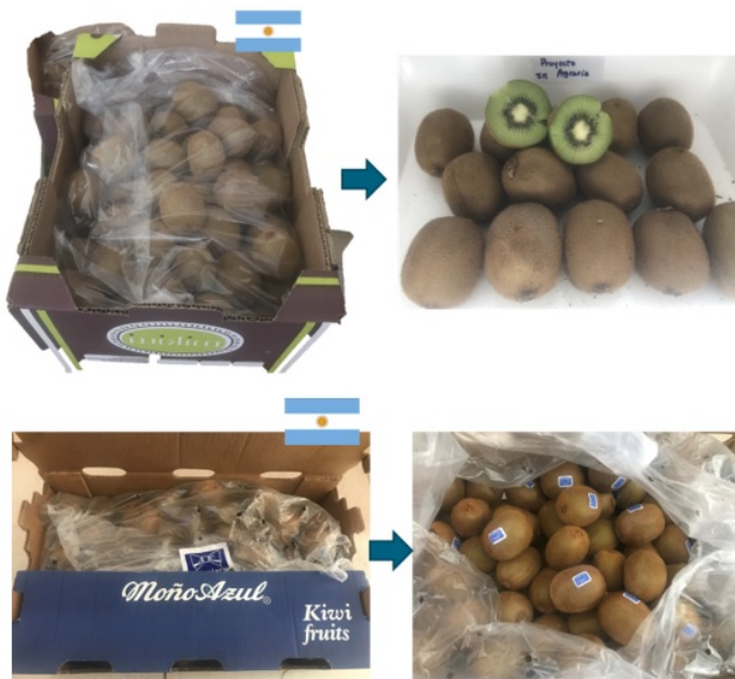
Foto 7: Kiwi de la región, parte de la muestra procedente del SEB. Septiembre 2020.

Los estudios del módulo III, se realizaron sobre la base de diez entrevistas a productores, representativos por estratos de hectáreas implantadas. Se indagó sobre las características del establecimiento y su propietario, la modalidad de producción y comercialización, la estructura de costos y las vinculaciones entre productores. Se obtuvo una estimación preliminar del valor agregado de la actividad en la región, con base en una estructura productiva modal. La discriminación de labores entre consumo intermedio y valor agregado, según los datos de costos