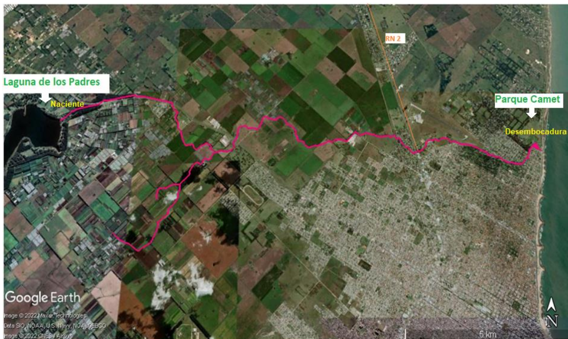
Figura 1. Recorrido del arroyo La Tapera, desde la Laguna de los Padres hasta la costa del Mar Argentino en Mar del Plata.