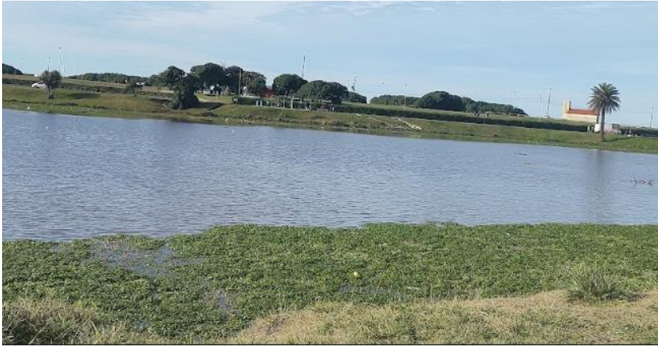
Figura 4. Curso bajo del arroyo La Tapera en Parque Camet