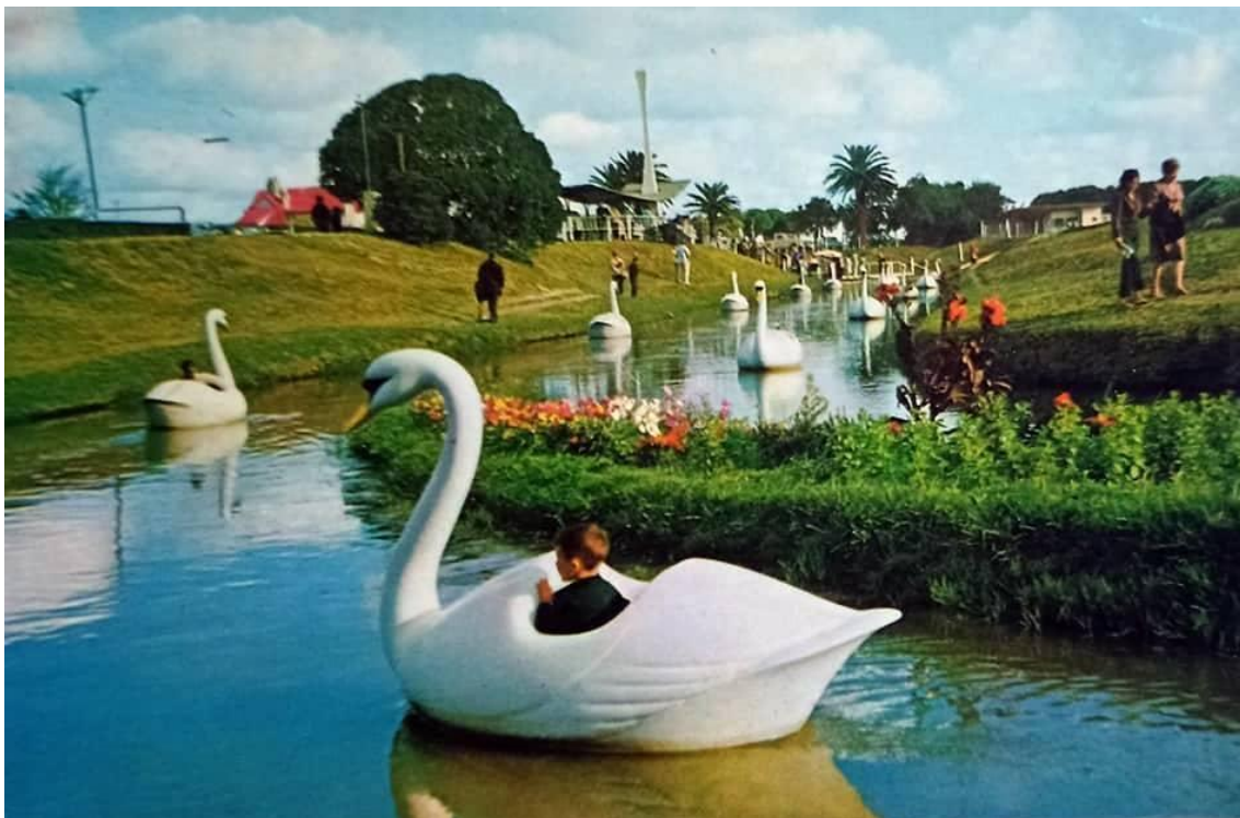
Figura 3. Paseo de los Cisnes

Desde la década de los años noventa, se destacan gran cantidad de normas que regulan los usos sobre Parque Camet. Ramirez (2021) identifica el Decreto 1863/93, donde se aprueba el Reglamento General para la Reserva Integral Laguna de los Padres y el Parque Camet. Entre los considerandos del decreto, se destaca la zonificación fijada por el plan de manejo que determina las actividades permitidas o no en cada zona. Por su parte, la Ordenanza 9717/94, declara al Parque Camet como Reserva Forestal y el Decreto 450/97 crea la unidad de gestión denominada “Programa de Revalorización y Renovación Física y Ambiental del Parque Camet”.