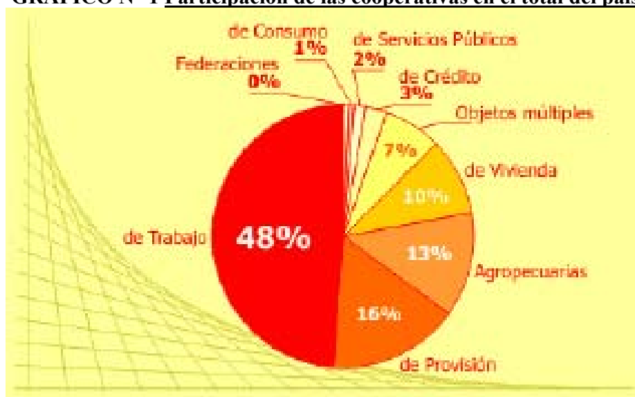
GRAFICO N° 1 Participación de las cooperativas en el total del país

En Argentina surgieron gran diversidad de cooperativas abarcando toda gama de actividades: Agrícolas, de Vivienda, de Trabajo, de Crédito, Eléctricas, de Enseñanza, Escolares, de Seguros, entre otras.