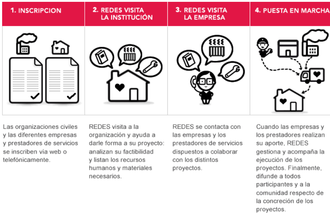
Figura 2. Mecanismo de funcionamiento de REDES