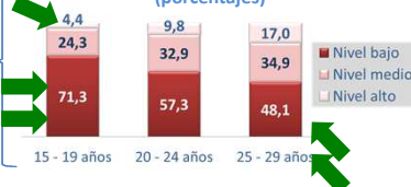
JÓVENES POR NIVEL DE INGRESOS DEL HOGAR (porcentajes)