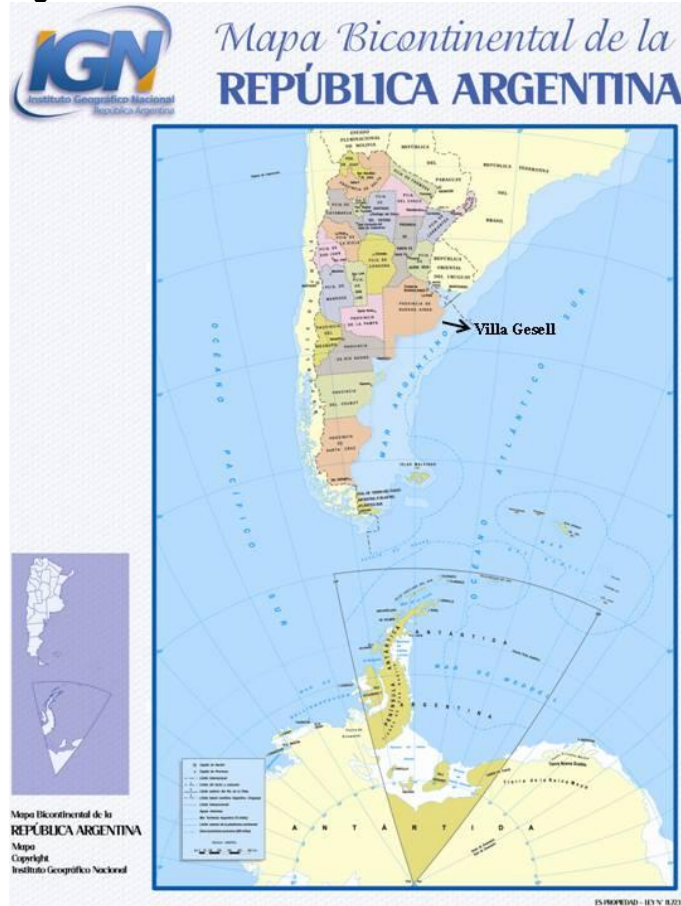
Figura Nº 1. Localización de Villa Gesell

Se encuentra a 360 km. de la Ciudad Autónoma de Buenos Aires, con acceso desde la Ruta Provincial Nº 11 - Interbalnearia, conectada hacia el norte con las rutas Nº 74 y 35. Posee una terminal de micros (Zona Sur) y un aeropuerto (a 2 km. de la rotonda de ingreso) y conexión ferroviaria a través de General Madariaga, distante a 45 km. de la ciudad.