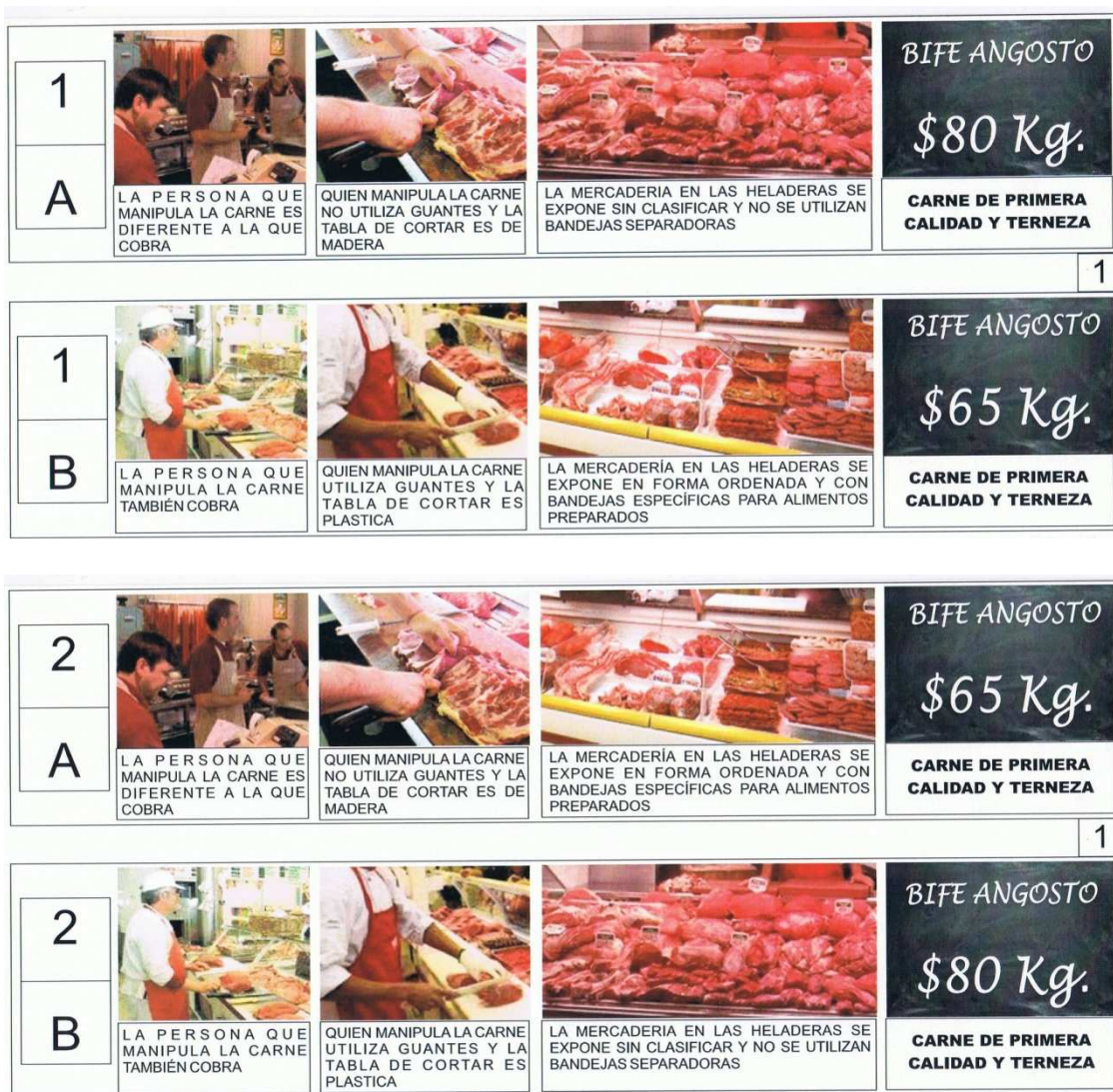
Figura 1 – Ejemplo de dos sets de elección incluidos en los CE