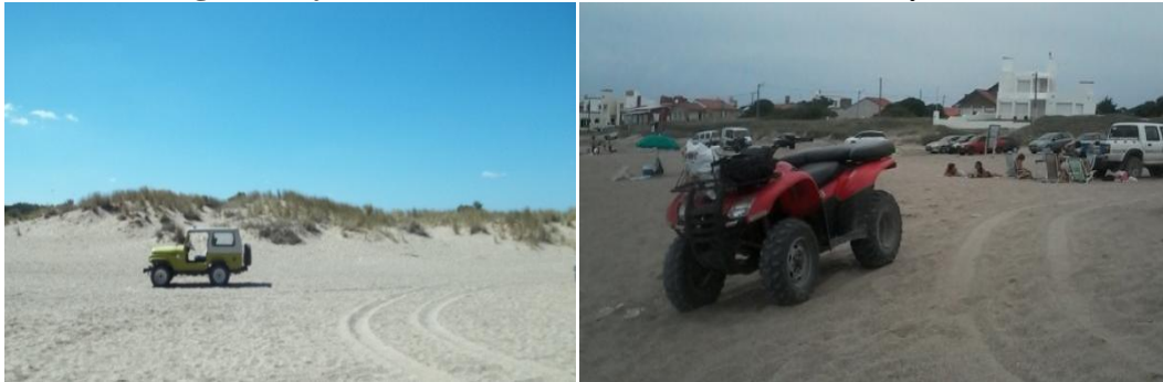
Figuras 2 y 3. Presencia de vehículos en área de sol y baño.

territorio litoral relacionados a la presencia de usos del suelo que resultan incompatibles (Figuras 2 y 3).