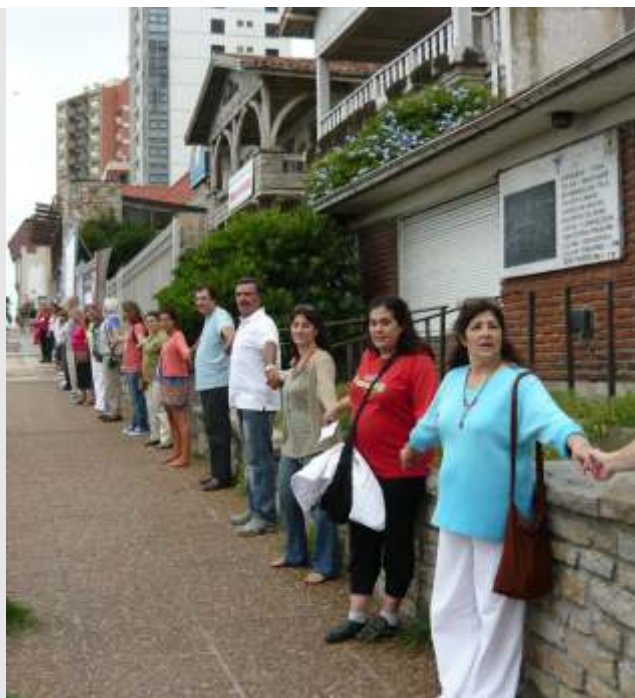
Manifestación de residentes marplatenses en defensa del patrimonio urbano. Abrazo al conjunto arquitectónico de la calle 11 de Septiembre, como reacción al pedido de desafectación patrimonial.

A nivel general se observó una mirada crítica hacia cuestiones relativas a la convivencia turista-