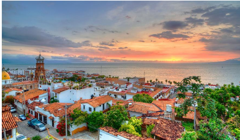
Puerto Vallarta: Centro Turístico Tradicional o Espontáneo