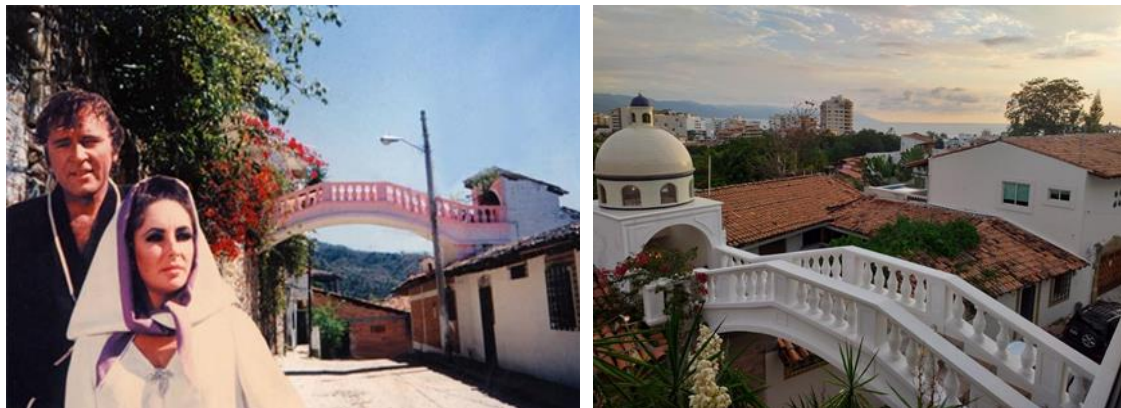
Imagen 2. Puente de Casa Kimberly

Según relatan los historiadores mexicanos, Richard Burton hizo de Puerto Vallarta su lugar, compró una propiedad llamada "Casa Kimberly" y se la obsequió a Elizabeth Taylor, allí disfrutaban juntos los días frente al mar, escapando de todo. Como la casa no tenía piscina, Burton compró luego la propiedad de enfrente, hizo construir una pileta y un puente (réplica del Puente de los Suspiros de Venecia) que une ambas propiedades a través de una pequeña calle empedrada. La pareja tuvo momentos de felicidad y de alejamiento, se casaron y divorciaron dos veces, a tal extremo que el puente fue demolido y reconstruido según los avatares sentimentales; luego se separaron definitivamente, cada uno se quedó con una casa, y posteriormente las vendieron. La fama alcanzada por la pareja permitió que Puerto Vallarta fuera conocido internacionalmente, y en la actualidad la visita a Casa Kimberly, abierto como hotel y restaurante, así como la foto bajo el puente son parte de los atractivos que identifican al lugar.