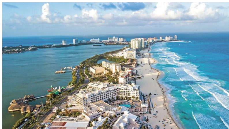
Cancún: Centro Turístico Integralmente Planificado