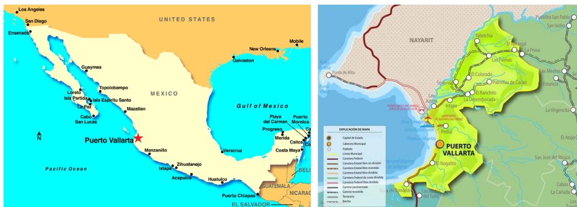
Imagen 1. Localización de Puerto Vallarta (México)

Puerto Vallarta se localiza en el Estado de Jalisco, sobre las costas del Océano Pacífico. Su devenir turístico responde a diferentes momentos y circunstancias. En la década de los años treinta es descubierto por turistas canadienses y estadounidenses, que son atraídos por las temperaturas estivales y primaverales, quienes escapándose de sus fríos inviernos encuentran en la ciudad el refugio perfecto para descansar y proyectar su tiempo de retiro. Surgen segundas residencias y muchos de estos turistas se incorporan a la actividad económica del lugar y compran tierras para instalarse.