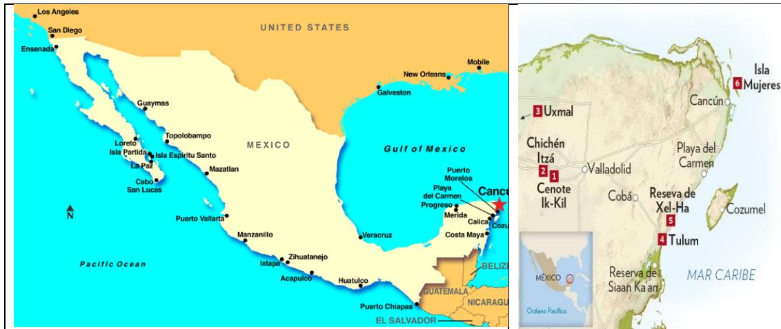
Imagen 3. Localización de Cancún (México)