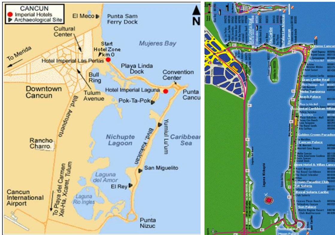
Imagen 6. Cancún y Zona Hotelera