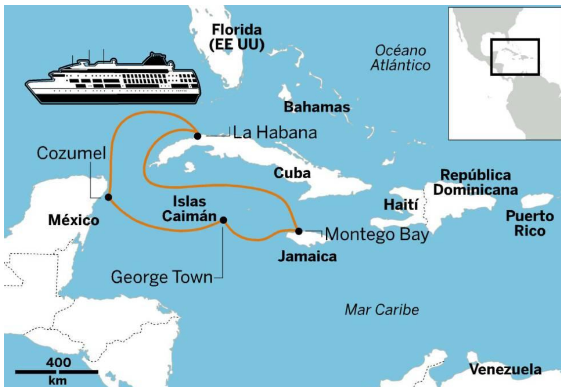
Imagen 3. Cruceros Mar Caribe: México/Cuba