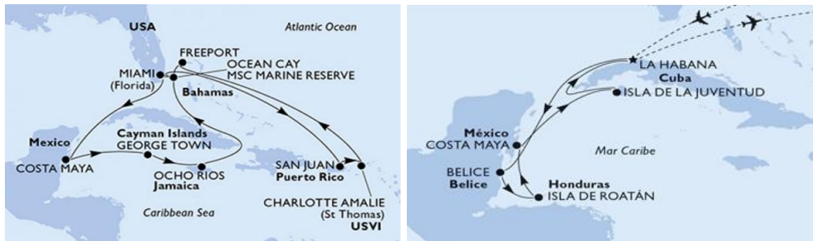
Imagen 4. Cruceros Mar Caribe

Dado que se trata de un Estado Asociado de Estados Unidos, su exitoso lugar queda englobado en la primacía estadounidense en la operatoria náutica.