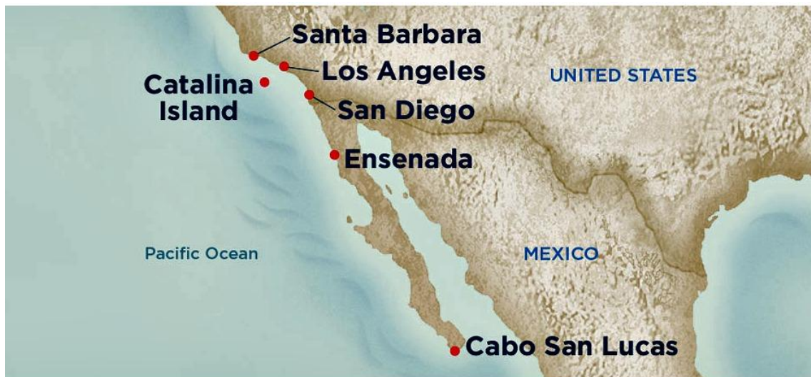
Imagen 11. Cruceros en Ruta Pacífico - EEUU-México

Otra región de cruceros se localiza sobre costas bañadas por el océano Pacífico, desde Los Ángeles (Estados Unidos) hacia Los Cabos (México), visitando San Diego y Santa Bárbara (EEUU), Ensenada y Cabo San Lucas (México), con duración de 3 y 4 días, y salidas semanales durante la temporada de cruceros.