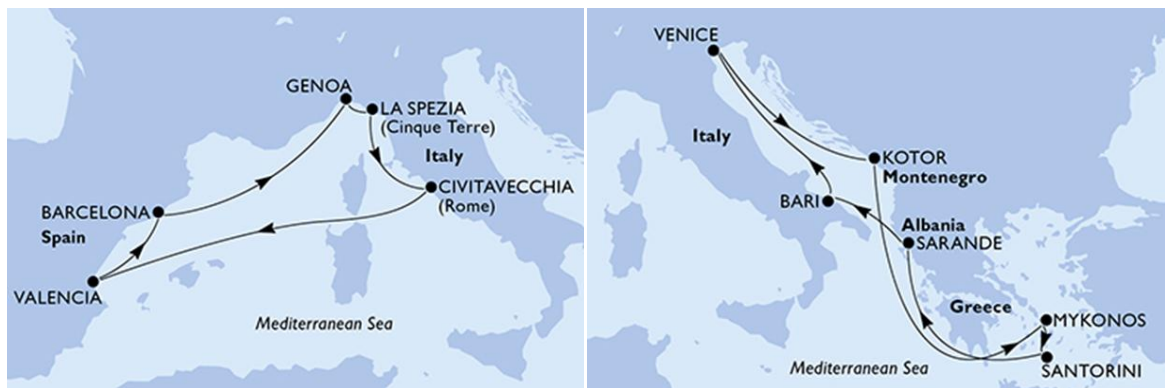
Imagen 1. Crucero Mar Mediterráneo – MSC Grandiosa - MSC Sinfonía

En opinión de Barrado y Calabuig (2001), el Mar Mediterráneo los principales focos emisores son: Marsella (Francia) y Génova (Italia), luego siguen en orden de importancia: Barcelona (España) y Séte (Francia). La estadía con mayor demanda tiene una duración inferior a una semana, los itinerarios contemplan la complementariedad mar-tierra, basada en la navegación por placer a partir de los atractivos que ofrecen las ciudades portuarias, tanto continentales (localizadas en ambas orillas del Mar Mediterráneo) como en los espacios insulares. Otra característica en la ruta de cruceros de esta cuenca marítima contempla la comunicación entre los puertos de origen del Norte (zona europea postindustrial emisora de demanda turística) y los puertos de destino del Sur (zona africana en vías de desarrollo), con importante presencia de atractivos turísticos de diversa índole: natural, étnica, cultural, histórica, etc., originando la integración de puertos de Túnez, Malta, Chipre, entre otros.