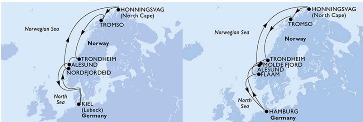
Imagen 7. Cruceros Mar del Norte – MSC Spléndida - Preziosa