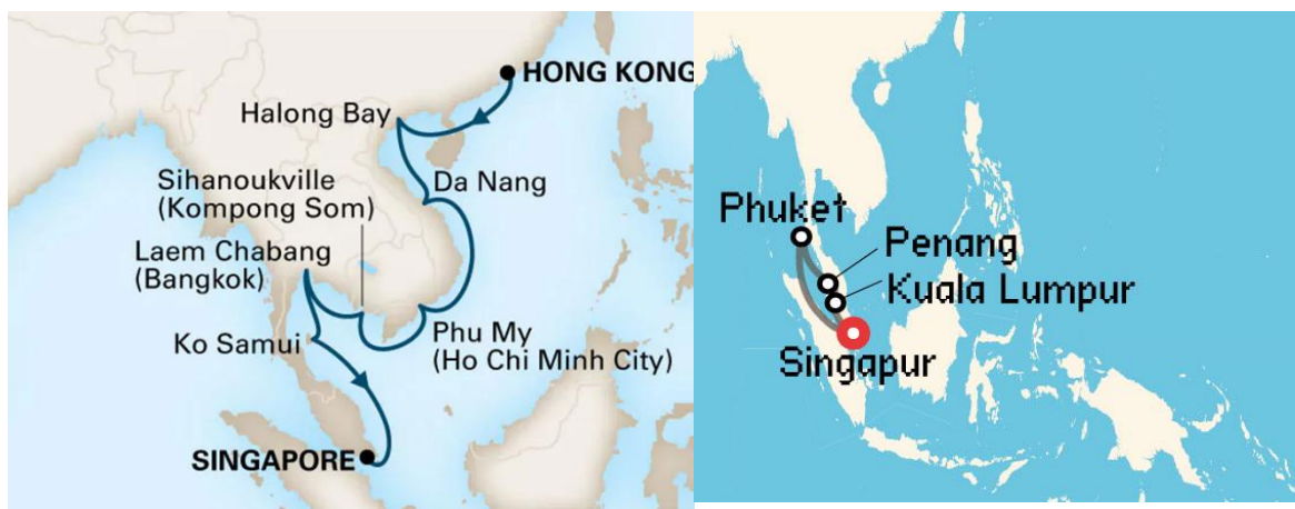
Imagen 9. Crucero Sudeste Asiático - Holland America Line

En el Sudeste Asiático, Singapur es el epicentro en la organización de las rutas de crucero en el Mar de la China Meridional. En esta cuenca marítima, los cruceros se complementan con otras modalidades turísticas, revisten un ámbito regional, y hay una fuerte presencia de demanda japonesa y australiana. Los ejes principales son: hacia Indonesia (Bali, Célebes, Flores), Tailandia (Patiala o Pattaya) y atravesando el estrecho de Malaca (con destino a las islas de Penang y Phuket).