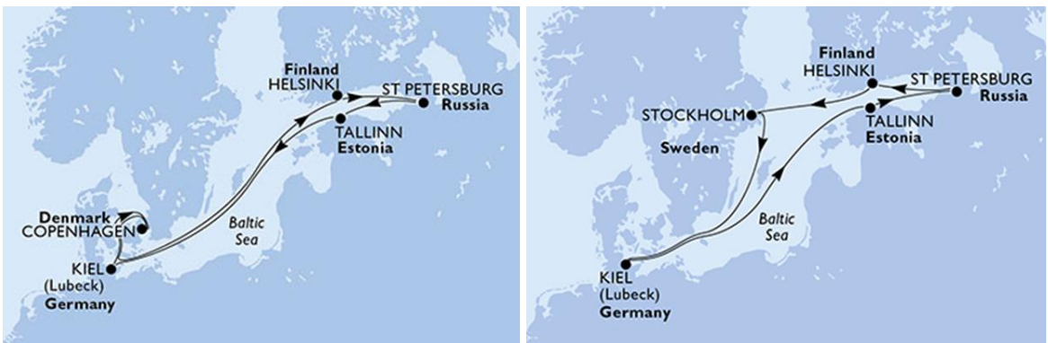
Imagen 8. Cruceros Mar Báltico – MSC Spléndida