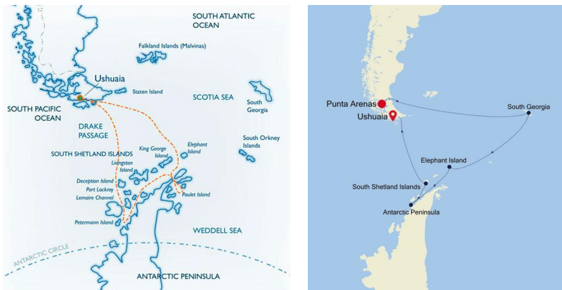
Imagen 13. Cruceros hacia la Antártida

Los cruceros que navegan los mares del fin del mundo se dirigen hacia Antártida, partiendo tanto de puertos chilenos (Punta Arenas, Puerto Williams) como de Ushuaia (Argentina). Estos cruceros están planificados para un segmento de demanda más inclinada hacia la contemplación de fauna autóctona, bajo la modalidad de turismo ecológico.