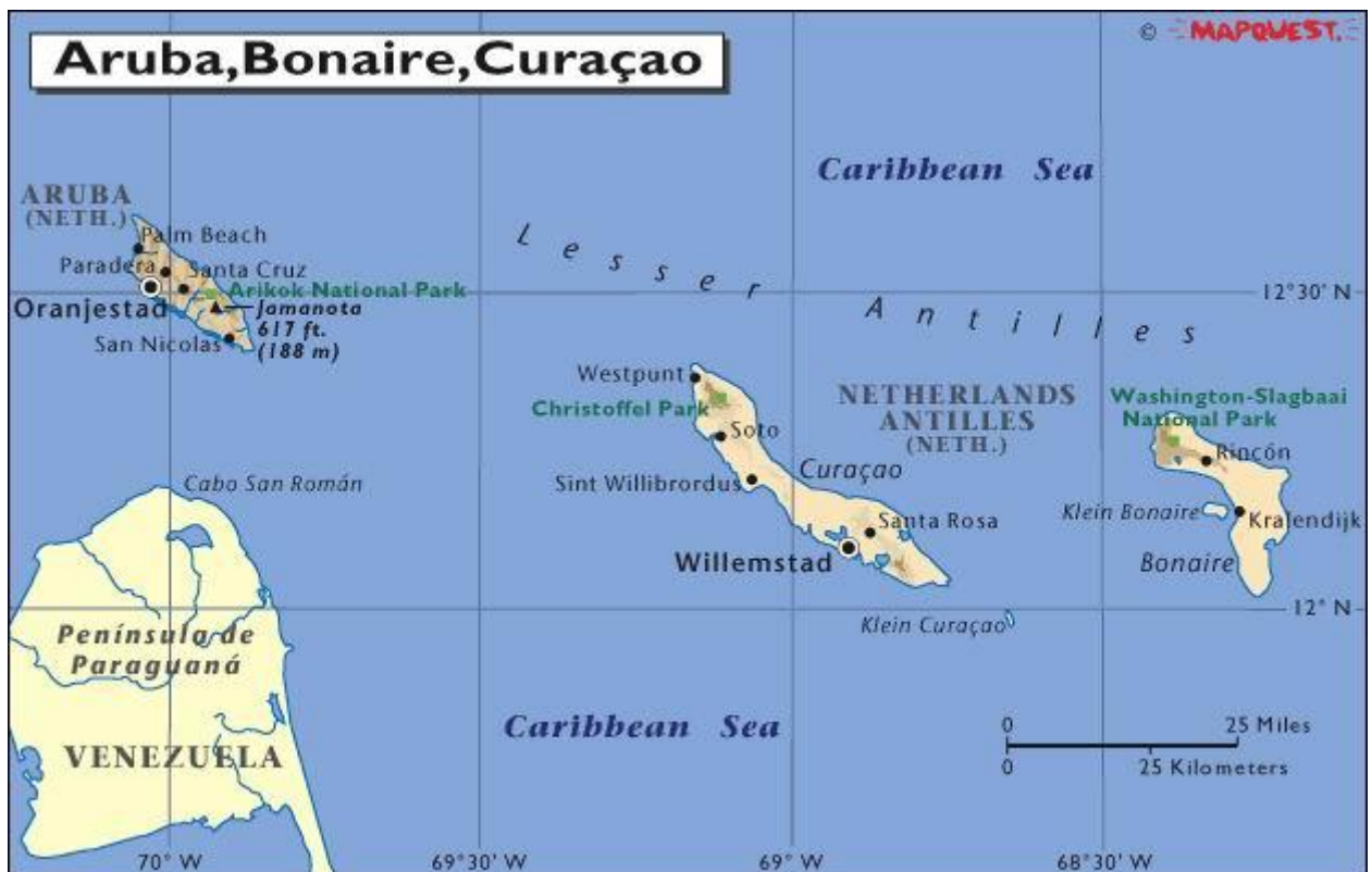
Imagen 16. ABC del Caribe Holandés (Aruba, Bonaire, Curazao)

dominantes de vientos, se encuentran fuera del área de huracanes del Caribe. Mientras la temporada turística de otras islas caribeñas se ve afectada durante los meses de junio a octubre a causa de los fuertes vientos del Atlántico, las islas ABC del Caribe Holandés cuentan un clima agradable que permite a los cruceros arribar durante todo el año.