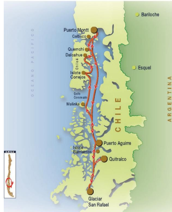
Imagen 12. Cruceros en Chile

Ruta Chonos zarpa de la Terminal Skorpios en la ciudad de Puerto Montt, navega 800 millas rumbo al encuentro con los hielos milenarios del Glaciar San Rafael, navega a través de archipiélagos, canales y golfos de la ruta Chonos y la posibilidad de recorrer este imponente territorio donde se encuentran ciudades y pueblos como Quemchi, Dalcahue y la aldea de pescadores de Puerto Aguirre, que nos muestran en todo su esplendor las maravillas de una naturaleza vigorosa que se refleja de la mejor manera en el Islote Conejos, Islote Barrientos y Fiordo Quitralco, con sus termas y excursiones en su extenso mar salpicado de islas.