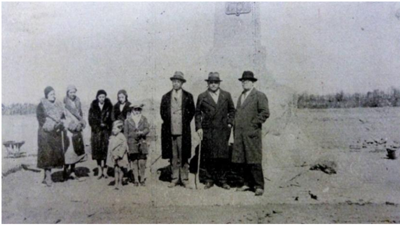
Figura 3. Turistas en el Campo Histórico El Plumerillo

Otra guía turística local que hace referencia a los sitios sanmartinianos es la “Guía de Mendoza” de Francisco Giménez Puga (1940) 17 .