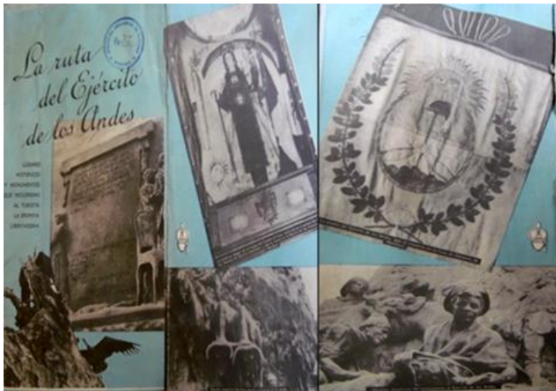
Figura 4. La ruta del Ejército de Los Andes