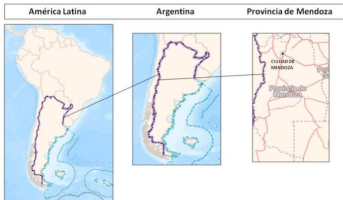
Figura 1. Localización geográfica de la Provincia de Mendoza y su ciudad cabecera, Argentina

mendocino tuvo un rol primordial durante la campaña libertadora liderada por el General José de San Martín en 1817, razón por la cual atesora numerosos sitios vinculados a la gesta y a la vida cotidiana del prócer.