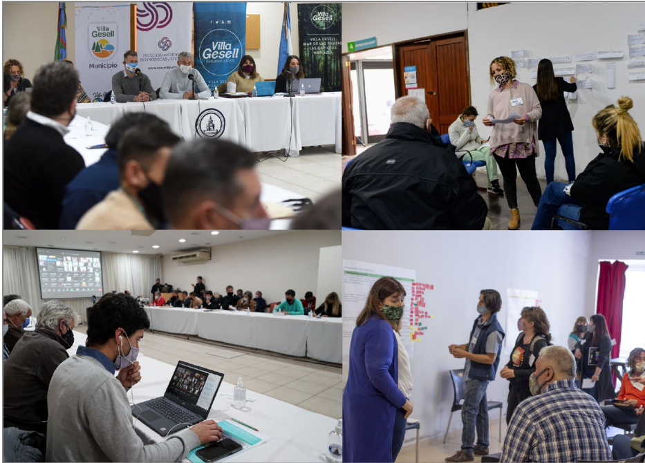
Figura 1: Trabajo en talleres con prestadores de servicios y residentes en formato híbrido