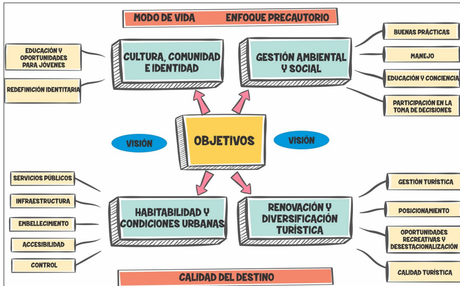
Figura 3: Síntesis de los objetivos