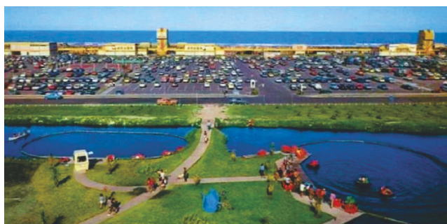
Figura 1 ESTACIONAMIENTO Y LAGUNAS DEL COMPLEJO PUNTA MOGOTES A PRINCIPIOS DE LOS AÑOS OCHENTA